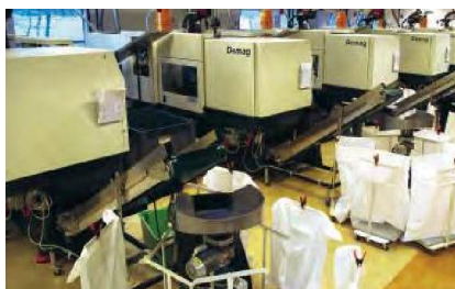
Pharma Systems använder elektromagnetisk vattenbehandling i kylsystemet till sina åtta formsprutmaskiner.

– När vi startade verksamheten 2002 så använde vi vanligt vatten i systemet. Vi ville undvika kemikalier och den hantering dessa innebär. Vartefter åren gått så har det blivit smuts och avlagringar i systemet och för några år sedan satte vi in ett filter i